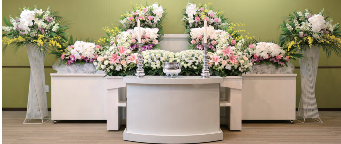
式場は最大30名様収容(20名様くらいが程よい家族葬におすすめのホールです)