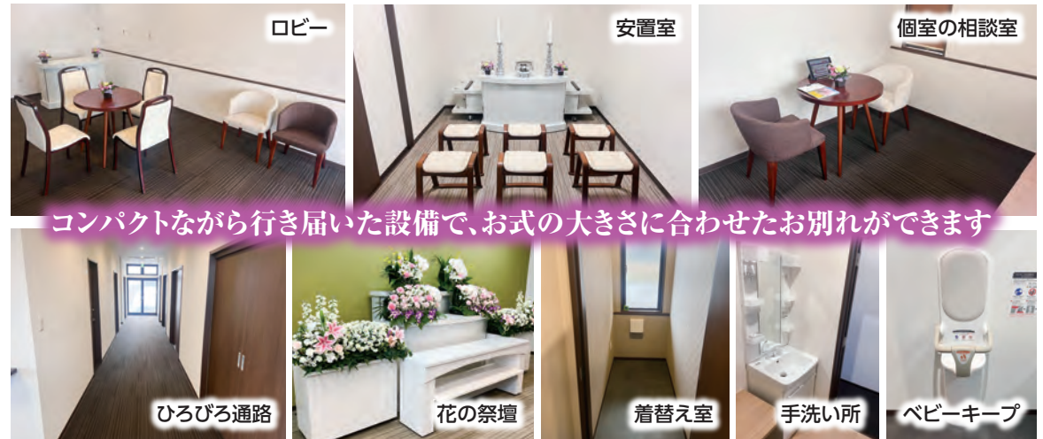
コンパクトながら行き届いた設備で、お式の大きさに合わせたお別れができます

自然葬を分かりやすくご案内致します。チャーターした船で行う海洋散骨模擬体験ツアーの参加者も募集中!